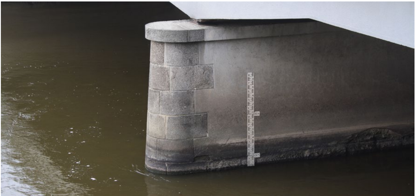
Escalas limnimétricas instaladas en la pila de un puente

Es un dispositivo de centrado que asegura mediciones fáciles y consistentes.